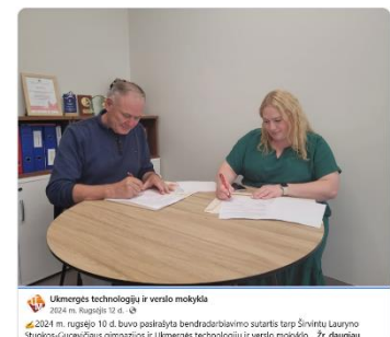
Ukmergės technologijų ir verslo mokykla 2024 m. Rugsėjis 12 d. 14. 14 2024 m. rugsėjo 10 d. buvo pasirašyta bendradarbiavimo sutartis tarp Širvintų Lauyno Stuokos-Gucevičiaus gimnazijos ir Ukmergės technologijų ir verslo mokyklos. Žr. daugiau

2024 metų rugsėjį pasirašyta bendradarbiavimo sutartis su Ukmergės technologijų ir verslo mokykla. Susitarta, kad nuo rugsėjo mėnesio gimnazijos III klasių gimnazistai turi galimybę mokytis Multimedijos techniko profesinio mokymo moduli programą. Gimnazistai, besimokantys pagal šią programą, prisideda prie gimnazijos įvaizdžio formavimo, įgyvendina naujas iniciatyvas, įtraukdami ir suburdami visą bendruomenę.