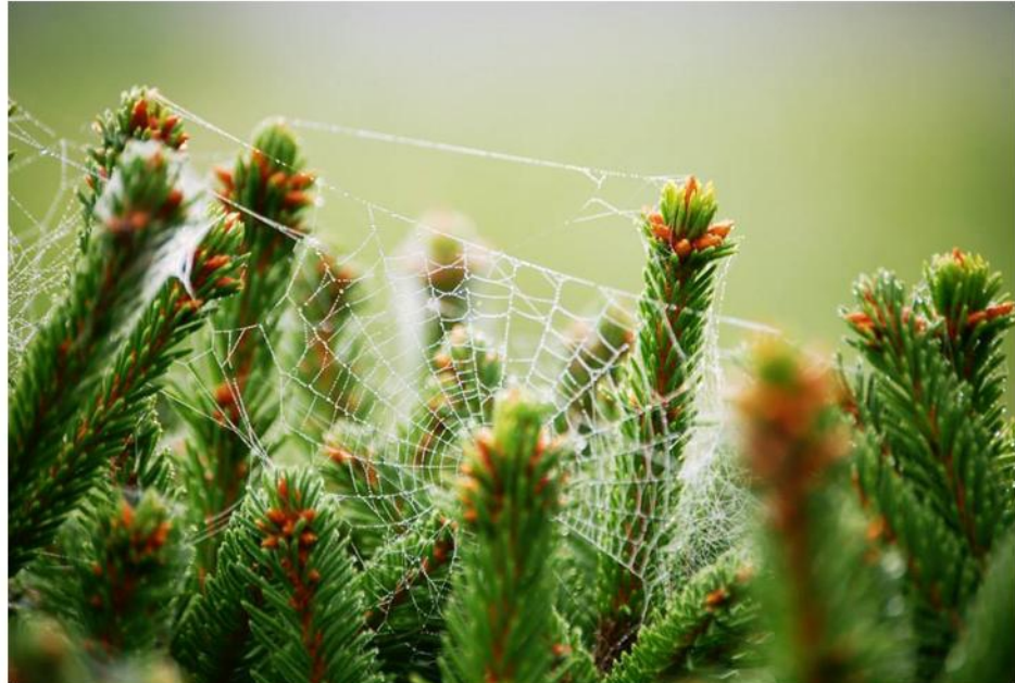
Fotografija – tai žavi akimirka, sustabdyta mūsų širdies akių... (Vaidas Lečas)